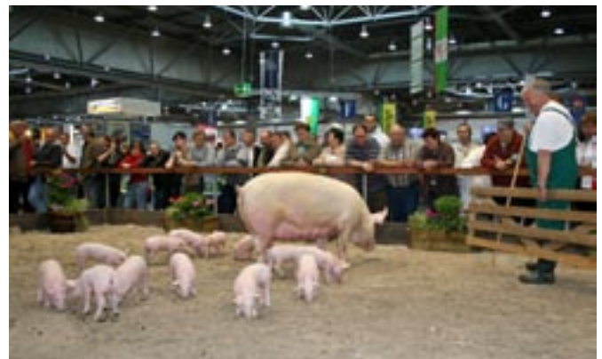
Die Sau mit 14 vitalen Ferkeln stand im Mittelpunkt des Zuschauerinteresses

Last but not least und unbestritten Publikumsliedling – die Kreuzungssau aus der Geratal Agrar GmbH Andisleben mit ihren 14 drei Wochen alten Ferkeln.