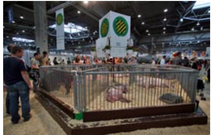
Das bewährte Schweinerondell zeigte sich wieder als größter Anziehungspunkt des Messestandes

Die weiterhin ausgestellten Mastläufer, durchweg TOP-Genetik-Abstammung, kamen aus der Sauenzuchtanlage Hart-