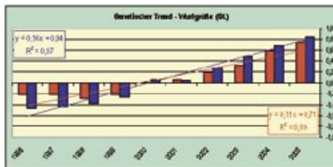
Abb. 2: Genetischer Trend für Wurfgröße der Thüringer DL-Population

Die geänderte Zuchtstrategie zeigte schnell die erwartete Wirkung: Während die auf Mast- und Schlachtleistungsmerkmale ausgerichtete Zuchtarbeit bis Ende der neunziger Jahre die Wurfgrößen nicht beeinflusste, entwickelte sich die Population ab dem Geburtsjahrgang 2002 in die gewünschte Richtung (Abb. 2). Die Berechnungen zum genetischen Trend basieren auf den mittleren naturalen Zuchtwerten innerhalb der im aufgeführten Geburtsjahr geborenen weiblichen (rot, quergestreift markiert) bzw. männlichen (blau, längsgestreift markiert) Tiere. In die Auswertungen gingen insgesamt 2.457 Eber und 14.862 Sauen der Deutschen Landrassepopulation ab dem Geburtsjahr 1995 ein. Im unteren kleinen Kasten ist der jährliche Zuchtfortschritt für