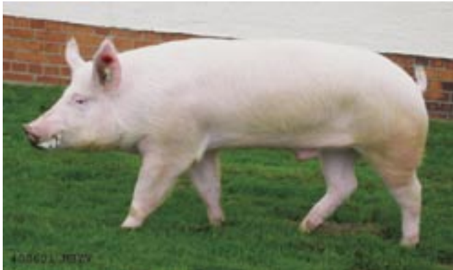
Henner 400604 RZ: 103 FB: 119 Züchter: Thomas Tillig, Ebersbach